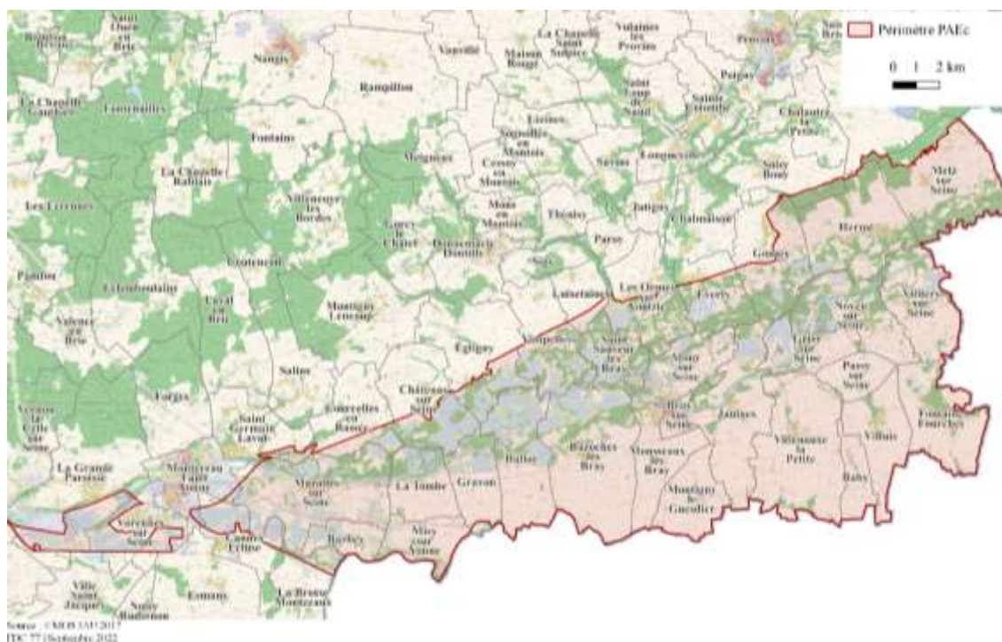
Carte du territoire « Bassée »

Le territoire « Bassée » (qui comprend les 2 sites Natura 2000 FR 1112002 et FR 1100798) se situe au sud-est du département de Seine-et-Marne, à la limite avec le département de l'Aube. Il englobe la majeure partie de l'écosystème de la Bassée (vaste plaine alluviale de la Seine en forme de fuseau, localisée entre Nogent-sur-Seine et Montereau-Fault-Yonne) dans sa partie Seine-et-Marnaise. Le site englobe également des territoires situés au Nord et au Sud de la vallée, constitués majoritairement de vastes plaines à caractère agricole.